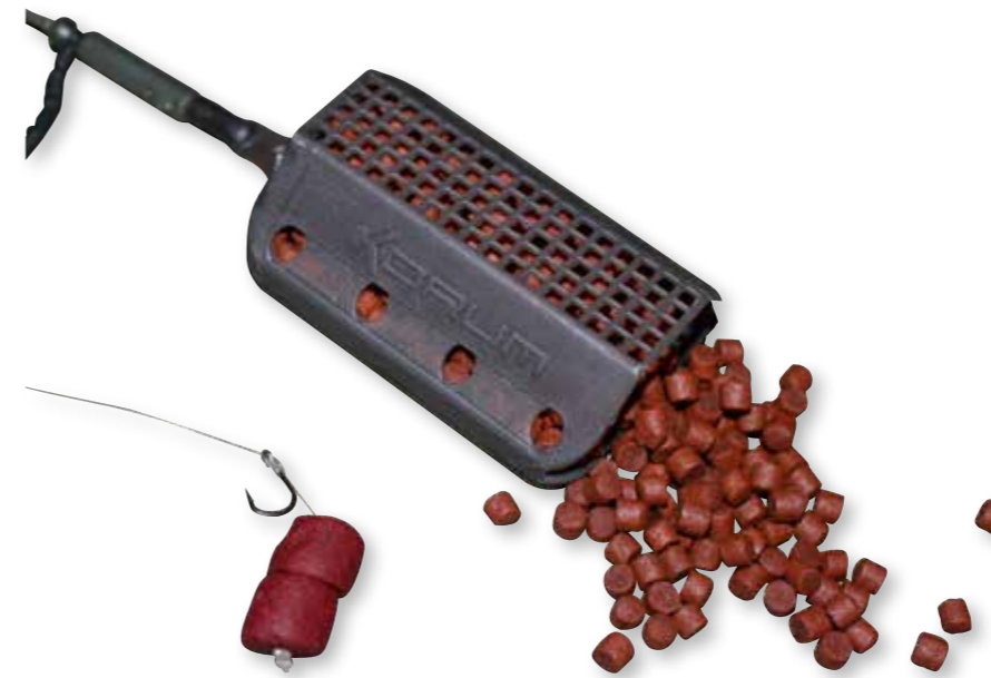
De River Feeder met zijn bijzondere stroombestendige vorm.

Feeder korf van Korum, die hier speciaal voor ontwikkeld is.