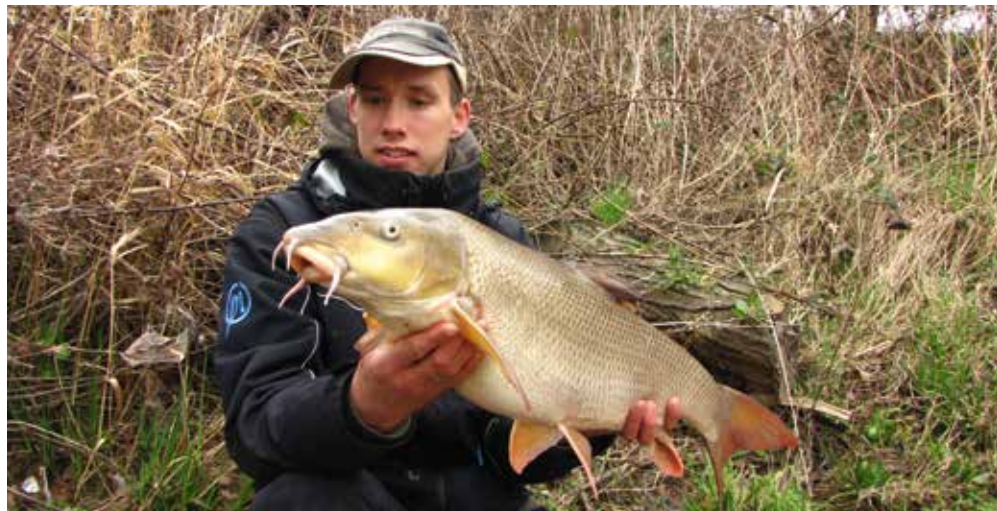
Een 6 kilo vis op een kleine winterse rivier!

Ik heb gedurende een behoorlijk lange periode op mijn visdagen de watertemperaturen gemeten. Ik dacht dat me dat veel nuttige informatie zou opleveren. Deels is dit ook waar, maar makkelijker is het om de omgevingstemperatuur te volgen. Een week lang goed weer met een stijging qua temperatuur is bijna altijd goed voor succes. Ik volg ook nationale en internationale websites om de temperaturen goed in de gaten te houden. Ook de windrichting en windkracht zijn