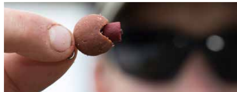
Modern aas voor de oeroude barbeel