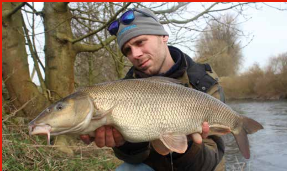
Ze blijven in ieder geval oersterk, ook in de winter.