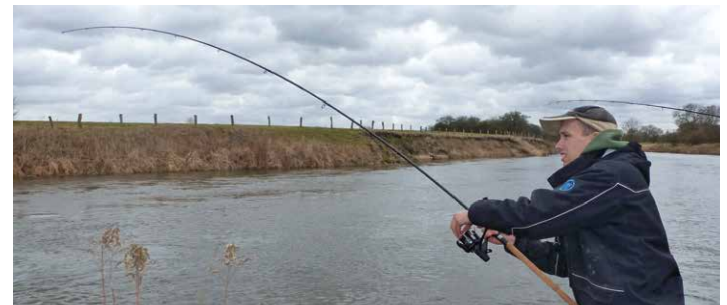
Geef de kleine rivieren een kans in de winter!