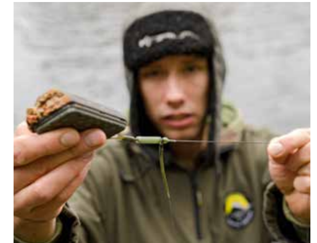
Dankzij de helicopter rig weinig drijf vuil op de haak.