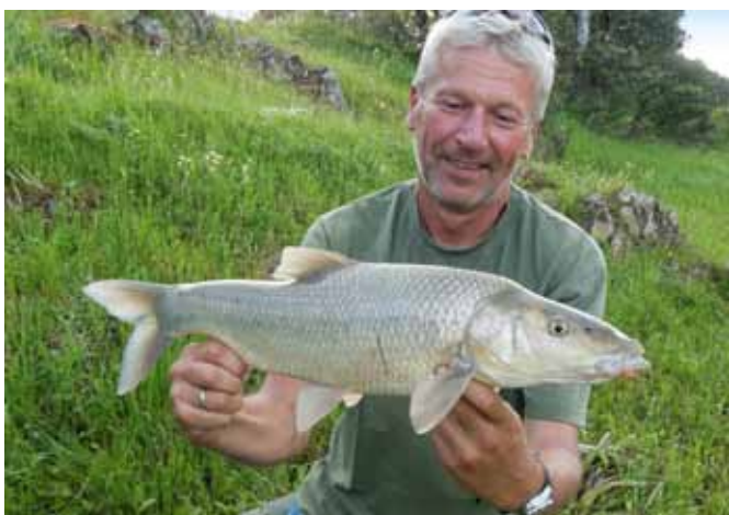
Sterke jongens hoor, die Spanjaarden...