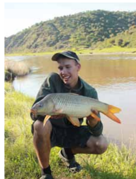
Altijd weer die Halibuts pellets!

staan. Als we na wederom twee nachten geen enkele aanbeet krijgen, staat ons besluit vast. We gaan nu echt voor de laatste keer verkassen en dit keer rijden we verwachtingsvol naar