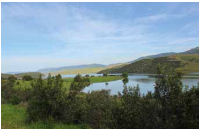
Ik ga beslist weer terug...