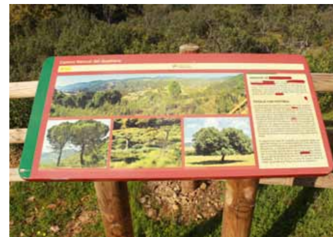
Het uitzicht kan minder...

Nadat we alles weer hebben ingepakt, staat ons een korte maar heftige tocht te wachten met een 4x4 terreinwagen en een aanhanger gevuld met al onze